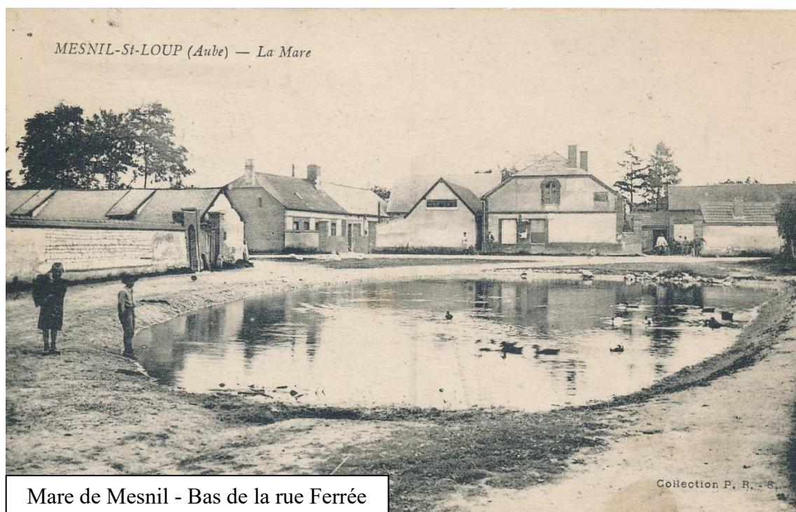
Mare de Mesnil - Bas de la rue Ferrée

** Prochain infomesnil : mercredi 2 avril 2025